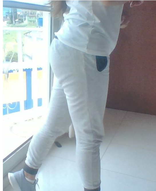
PASO ATRÁS CON ROTACIÓN DE TORSO PIERNA IZQUIERDA

Ahora veremos los brazos para este paso, deben estar completamente extendidos, el brazo derecho acompaña la pierna derecha extendiéndose hacia arriba y el brazo izquierdo va hacia el frente. El brazo izquierdo acompaña la pierna izquierda extendiéndose hacia arriba y el brazo derecho va hacia el frente. Así: