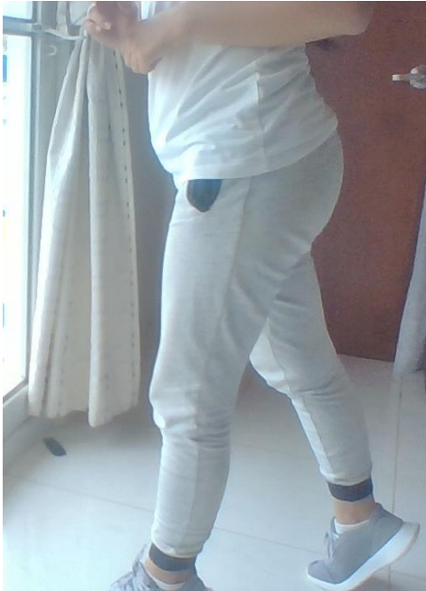
PASO ATRÁS CON ROTACIÓN DE TORSO PIERNA DERECHA