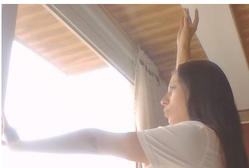
ACOMPañAMIENTO A PIERNA DERECHA

Ahora veremos los brazos para este paso, deben estar completamente extendidos, el brazo derecho acompaña la pierna derecha extendiéndose hacia arriba y el brazo izquierdo va hacia el frente. El brazo izquierdo acompaña la pierna izquierda extendiéndose hacia arriba y el brazo derecho va hacia el frente. Así: